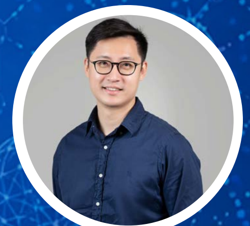
Hsin-Yung Yen Institute of Biological Chemistry, Academia Sinica

Venue : 1F Conference Room, Genomics Research Center, Academia Sinica