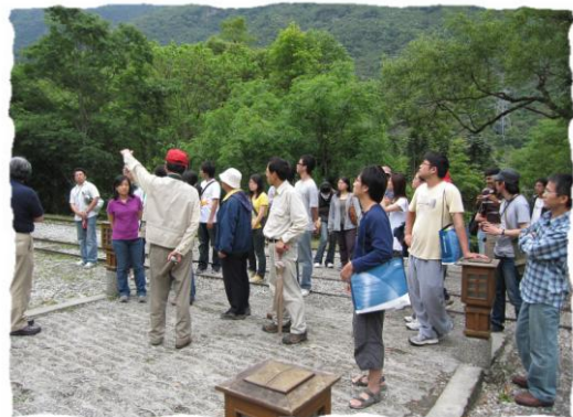
志工介紹林田山林場的歷史