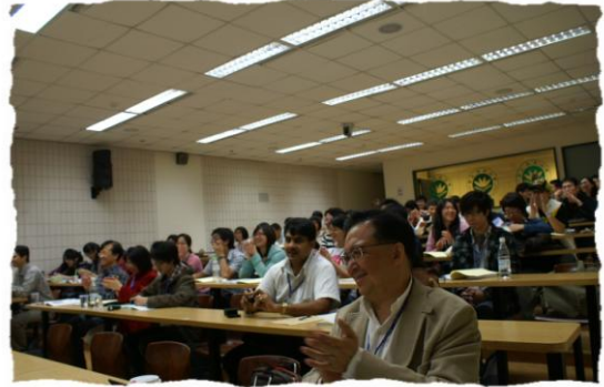
討論會演講進行中-I