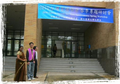
東華大學第三講堂入口