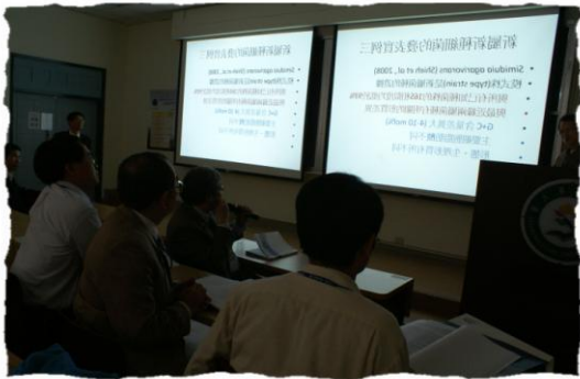
討論會演講進行中-II