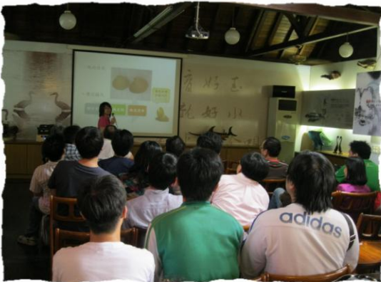
聽取黃金蠅的生長過程介紹